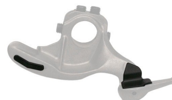
Protectores de plástico para uñas metálicas