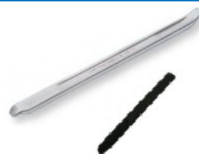
Palanca desmontable y funda de plástico