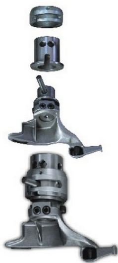
Uña para ruedas de moto con enganche rápido