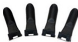
Protectores de plástico para garras