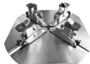
Conjunto de garras para ruedas de