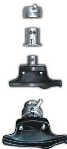
Uña de plástico para llantas de aluminio con enganche rápido