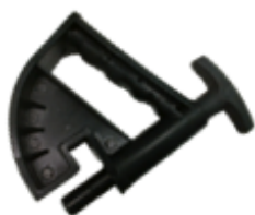
Mordaza par ruedas "Run-Flat"