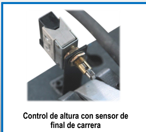
Control de altura con sensor de final de carrera