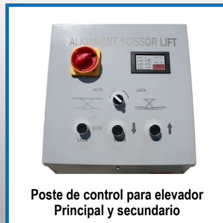
Poste de control para elevador Principal y secundario