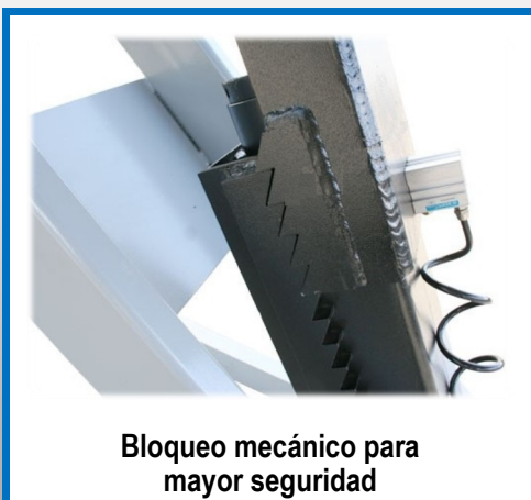
Bloqueo mecánico para mayor seguridad